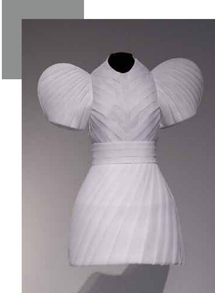
Jameel Prize ödüllü İstanbul Contrast koleksiyonundan "Galata."