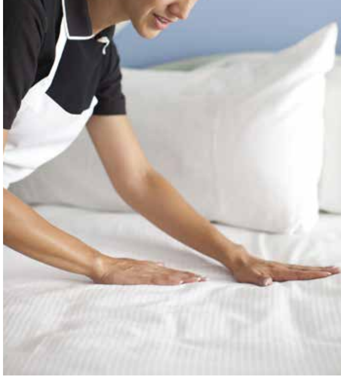
Temizlik ve house keeping