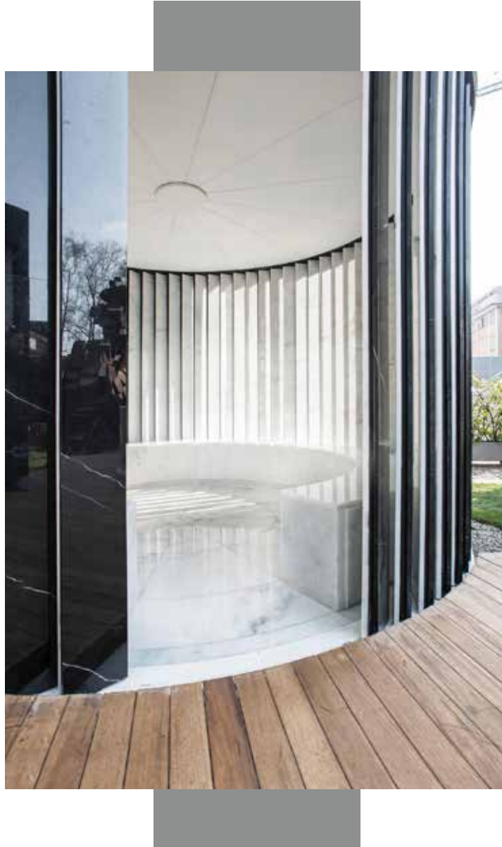
Milano Tasarım Haftası'nda sergilenen Türk Hamamı tasarımı "Nebula"